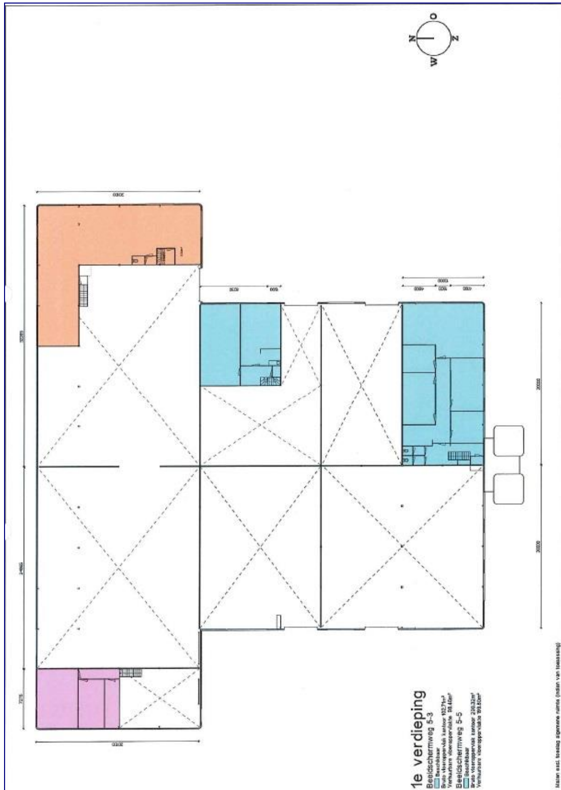
Plattegrond eerste verdieping